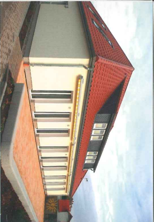
(Ansicht der Tagungsstätte)