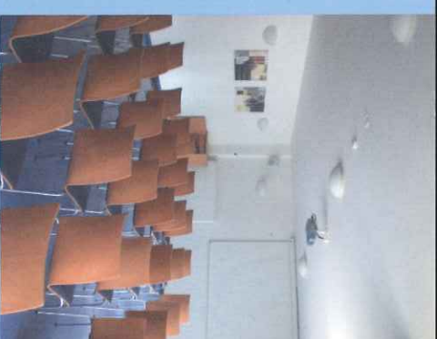
(Saalbestuhlung bis zu 60 Personen)