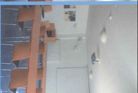
(Tagungsbestuhlung bis zu 45 Personen)