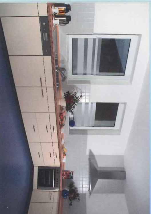
(Die Küche ist mit Geschirr, Gläsern, etc. komplett ausgestattet.)